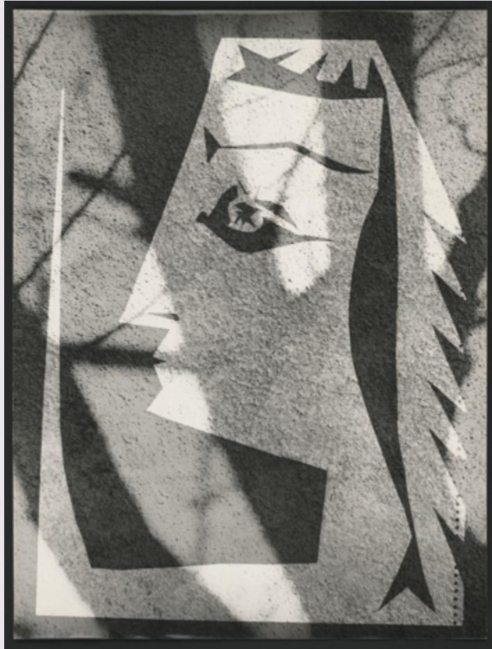
© RMN-Grand Palais (Musée national Picasso-Paris) / Image RMN-GP VILLERS André, Tête de femme de profil en surimpression sur un mur , Paris, 2017

En ligne : http://www.centre-hubertine-auclert.fr