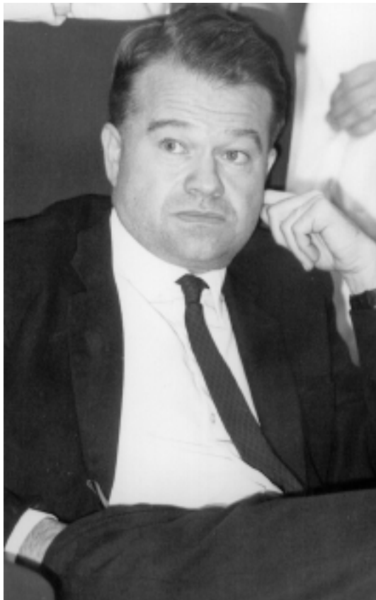
Le Pr Franz Lavenne (1919 – émérite 1985 - † 1988)