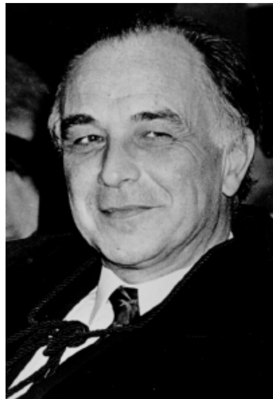
Le Pr Jean Sonnet (1921 – émérite 1987 - † 1992)