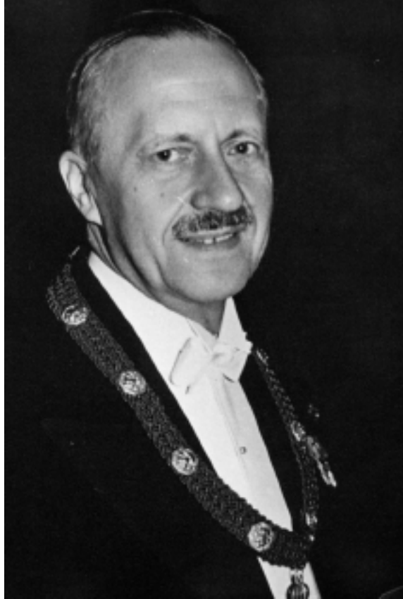
Le Pr Paul Lambin, titulaire de la chaire de pathologie interne (1933 – 1963) et chef d'un des deux services de clinique médicale (1948 – 1963).