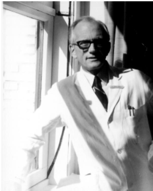
Le Pr Michel De Visscher (1915 – émérite 1980 - † 1981). Ci-dessus, vers 1965.