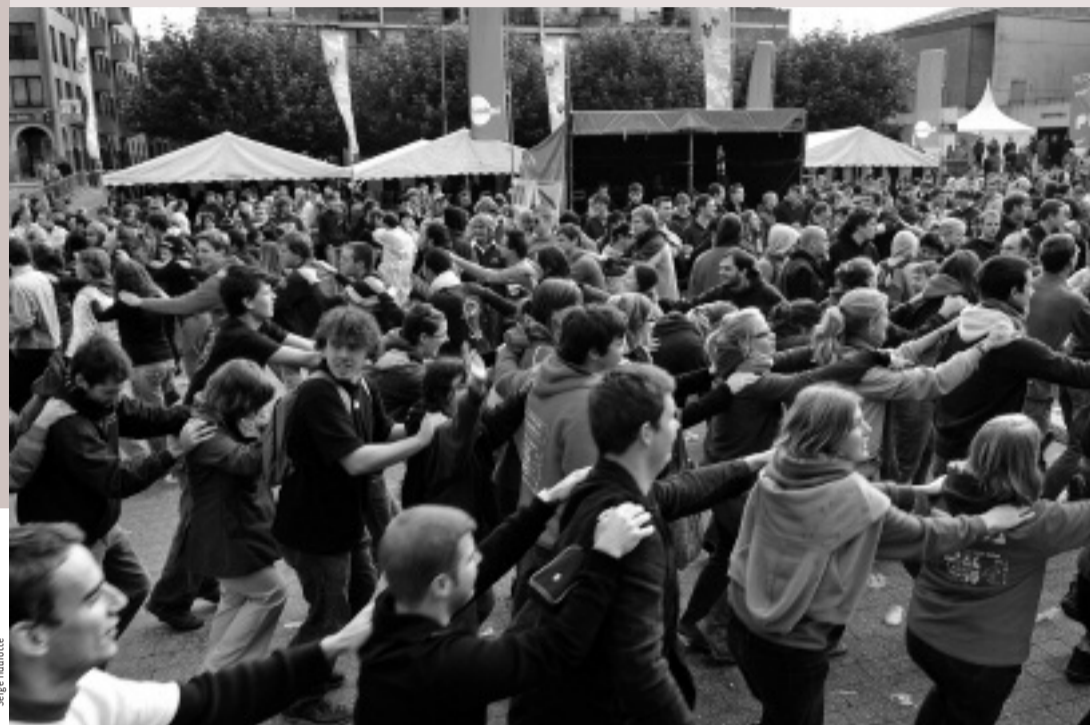
Jeudi matin, les étudiants font la farandole sur les airs du Grand Jojo.