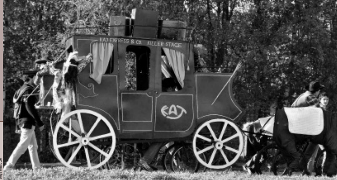
La diligence du Kot-à-jeux a remporté le prix du plus beau vélo folklorique.